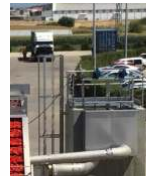
COMPUERTAS DE ACERO INOXIDABLE MOTORIZADAS