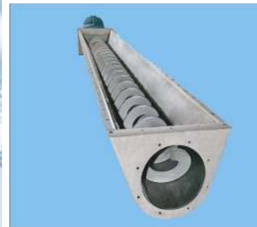
SINFÍN DE ARRASTRE TIPO ARQUÍMEDES