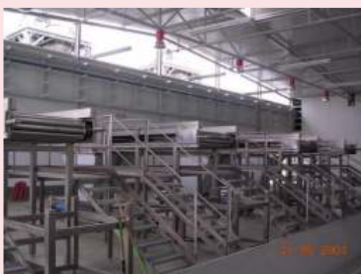
MESAS DE SELECCIÓN