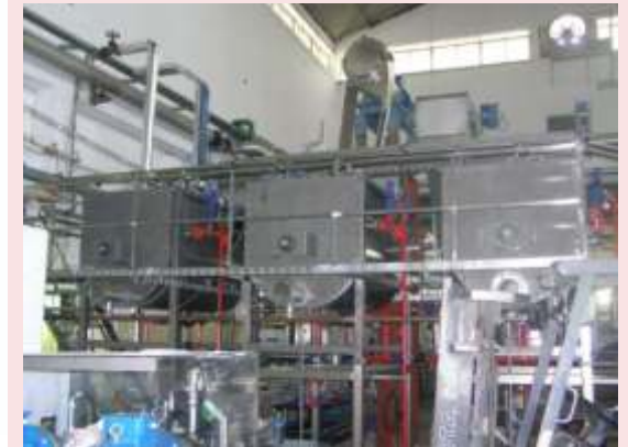
DEPÓSITOS DE MEZCLA