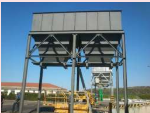
TOLVAS DE PIELES Y SEMILLAS