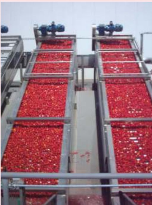
ELEVADORES DE RODILLO

Nuestros servicios y nuestro compromiso con nuestros clientes nos lleva a proveer de todo tipo de mantenimiento y repuestos.